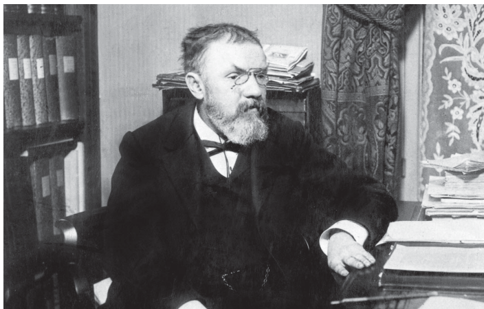
Henri Poincaré (1854—1912).

Dans son Mémoire sur la probabilité des causes par les événements (1774), Laplace se propose de « déterminer le milieu que l'on doit prendre entre trois observations données d'un même phénomène » (le « milieu » étant ici, pour Laplace, le milieu de probabilité , que l'on appelle aujourd'hui la médiane ). Pour ce faire, il va d'abord déterminer la loi de la courbe \phi des « probabilités que l'observation s'éloigne de la Vérité ». Or, nous dit-il, « voici les propriétés de